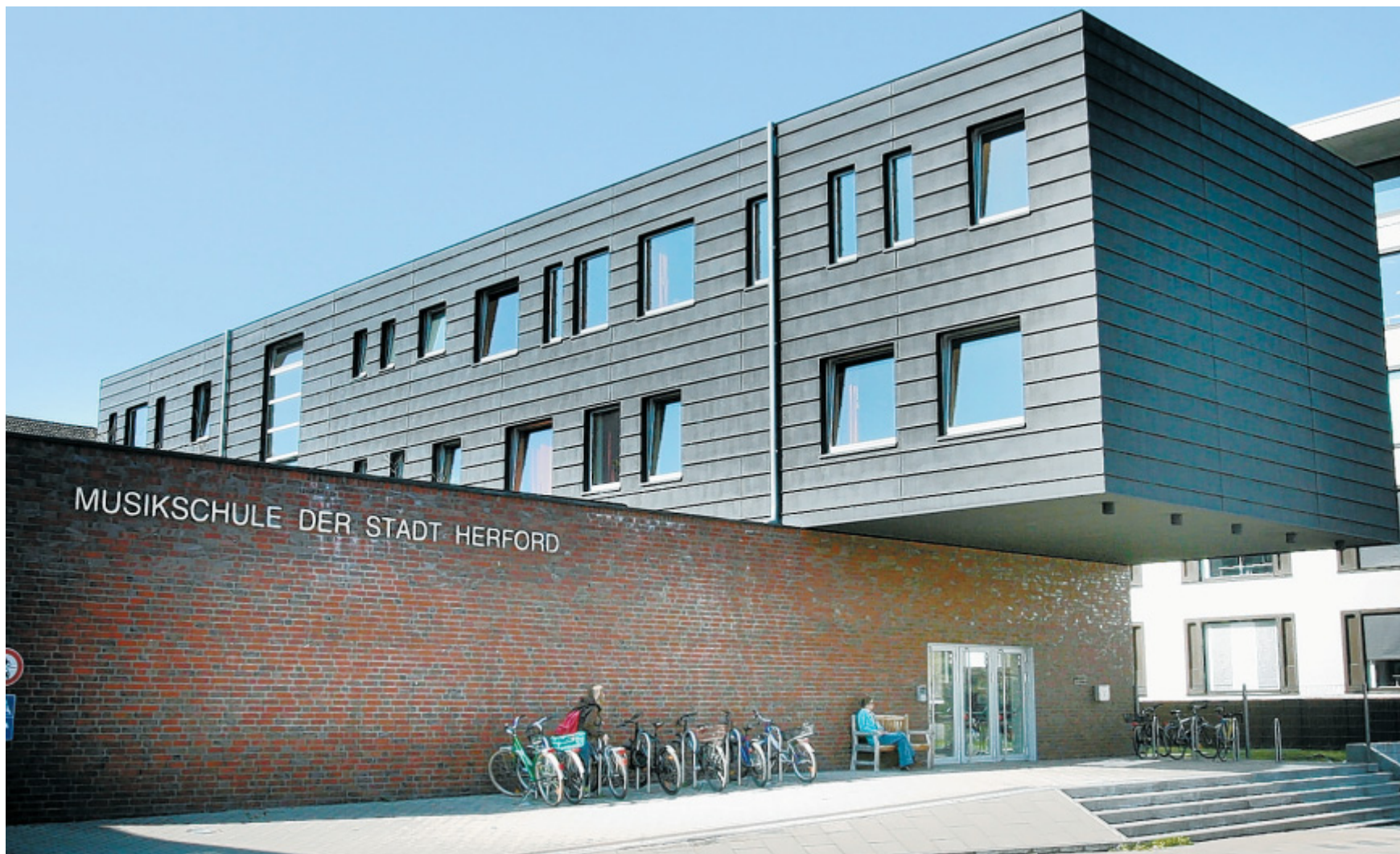
Kulturquartier: 2004 konnte die Musikschule Herford an die Goebenstraße umziehen. Sie verfolgt den Anspruch, in der Umsetzung ihres Bildungsauftrages der Architektur ihres neuen Gebäudes in Aktualität und Modernität nicht nachzustehen.