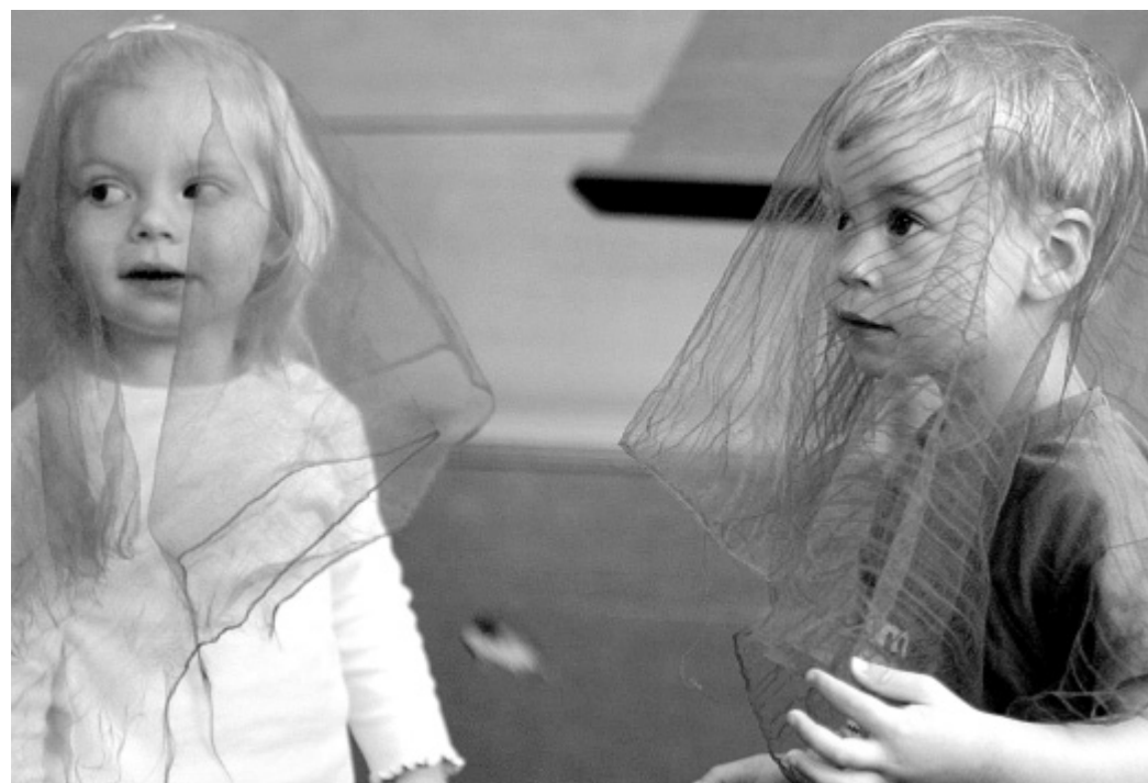
Musik, Sprache, Bewegung: Durch Tanz und Spiel lernen die erst dreijährigen „Musikschulwichte“ Kreativität, die die Türen zu einer musikalischen Ausbildung öffnet und sich in vielerlei Hinsicht positiv auf ihre Persönlichkeitsentwicklung auswirkt.

■ Herford. In Zeiten leerer Kassen kommen Musikschulen sowie andere Kulturinstitutionen in kommunaler Trägerschaft als so genannte „freiwillige Leistungen“ auf den Prüfstand. Nach Bezug des neuen Gebäudes in der Goebenstraße und der Überführung in die Kultur gGmbH hoffen Musikschulleitung und Kollegium, dass sich die Schule sowohl mit altbewährten als auch mit neuen Konzepten als Kultur- und Bildungsinstitution erhalten lässt und zur Bewältigung zukünftiger Aufgaben weiter entfalten kann.