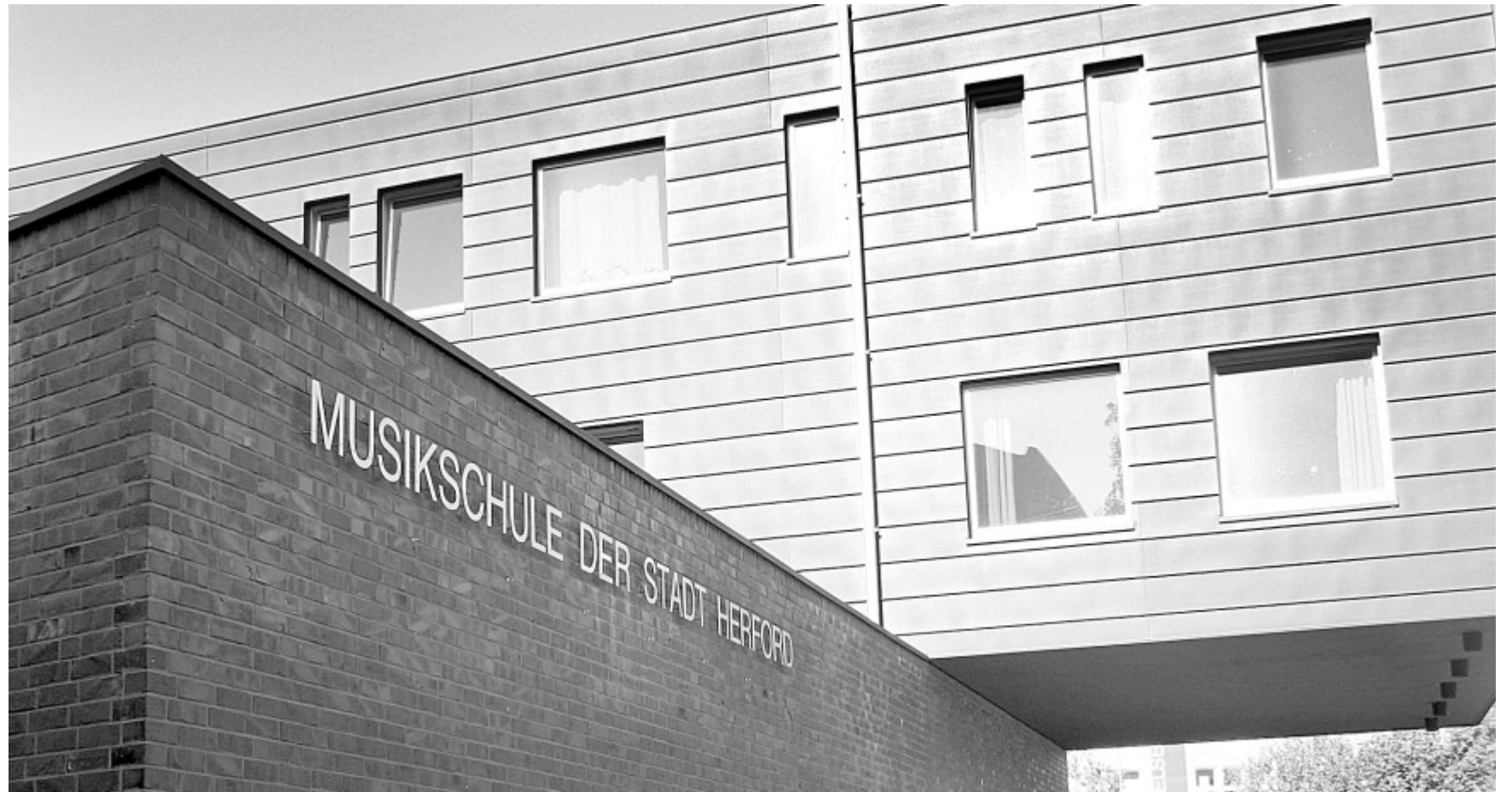
Musik im Kulturquartier: Das neue Gebäude der Musikschule Herford an der Goebenstraße wurde 2004 bezogen. Die Musikschule verfolgt den Anspruch, in der Umsetzung ihres Bildungsauftrages der Architektur in Aktualität und Modernität nicht nachzustehen.

Am Ende Projektes präsentierten sich die Prinzessin und sieben Zwerge in ungewohnt neuem Sprachmantel bei einer Aufführung für die Eltern und auf einer Tonaufnahme, die von den Kinder anschließend als CD mit nach Hause genommen werden durfte.