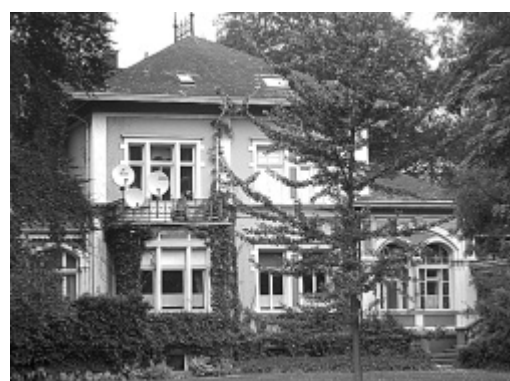
In herrlicher Parklandschaft: Es fiel nicht leicht, sich von diesem Haus zu trennen, aber nach 34 Jahren war es in der Rühlschen Villa am Lübbertorwall für den Musikschulbetrieb viel zu eng geworden.