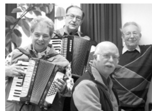
Senioren machen Musik: Das Instrumentalensemble im Haus unter den Linden wurde 1996 mit Unterstützung des Landes NRW gegründet und wird bis heute von der Musikschule betreut.

und machten von ihrem Ansehensrecht im Kulturausschuss Gebrauch. Finanzielle Einschnitte für die Musikschule ließen sich dadurch zwar nicht verhindern – sie zogen sowohl strukturelle Veränderungen als auch arbeitsvertragliche Auswirkungen für die Lehrkräfte nach sich – jedoch verblieb die Entscheidung über die grundsätzliche Gestaltung der Angebotspalette in der Musikschule.